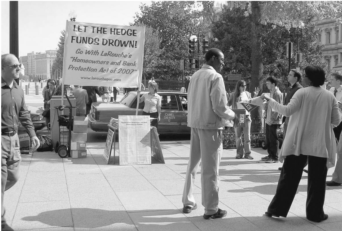
Miembros del Movimiento de Juventudes Larouchistas organizan en las calles de Washington, D.C. el 17 de octubre de 2007, a favor de la ley de Protección a los Bancos y Propietarios de Vivienda de LaRouche. Más de cien órganos de gobierno estatales y locales de EU han aprobado o debatido la aprobación de esta ley. (Foto: Joanne McAndrews/EIRNS).

ción privada bajo control del gobierno federal. La Reserva Federal seguiría funcionando, estaría de pie, pero bajo control del Tesoro, del Departamento del Tesoro del gobierno.