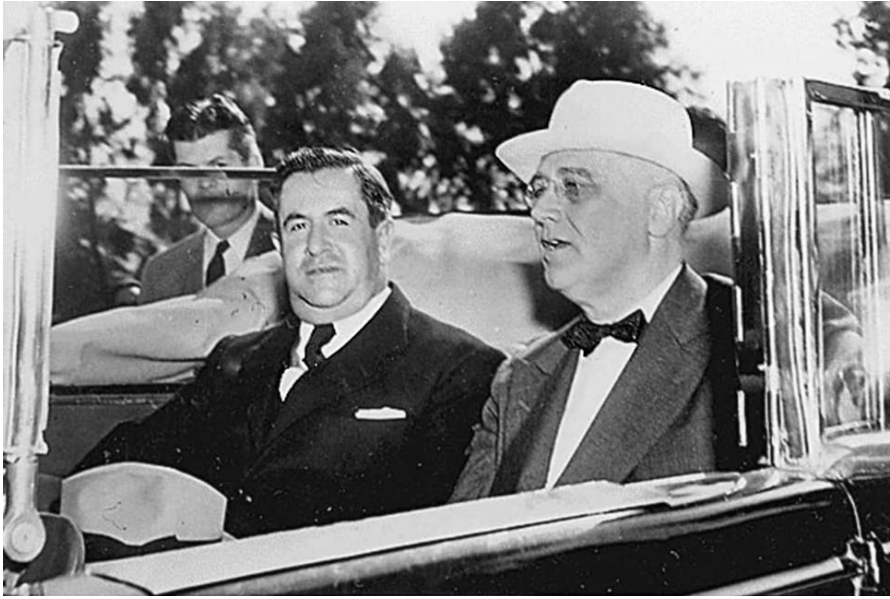
La política de Roosevelt para la posguerra era aprovechar el potencial agroindustrial de EU, movilizarlo, convertirlo para usos pacíficos, y liberar a las colonias del mundo. Los presidentes Franklin Delano Roosevelt y Manuel Ávila Camacho se reúnen en Monterrey, México en abril de 1943.

coloniales en todo el mundo desde entonces; no tenía por qué existir nada de esto.