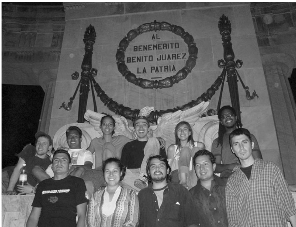
LaRouche habló de la cualidad del liderato en su respuesta a una pregunta: “¿Estoy haciendo algo para producir una nueva generación de gente joven capaz de hacer lo que yo, pero mejor? Ésa es la función esencial de los pronósticos. ¿Se puede pronosticar la política necesaria? Y, ¿puede pronosticarse fomentando el desarrollo de jóvenes que habrán de convertirse en los líderes del futuro?” El Movimiento de Juventudes Larouchistas posa ante el monumento a Juárez en la Ciudad de México.

Por consiguiente, no hay razón por la que en ningún momento debamos tener una depresión físico-económica, ninguna, si desarrollamos la mente de nuestros pueblos, en particular los poderes creativos de nuestros pueblos. Y si usamos su aporte creativo, si estimulamos esos aportes, nunca hay una razón para tener una depresión físi-