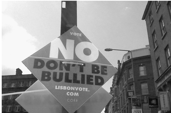
El inequívoco “No” de Irlanda al tratado de Lisboa es un golpe mortal al intento de la oligarquía anglohollandesa de obligar a Europa a someterse a una dictadura mundial.