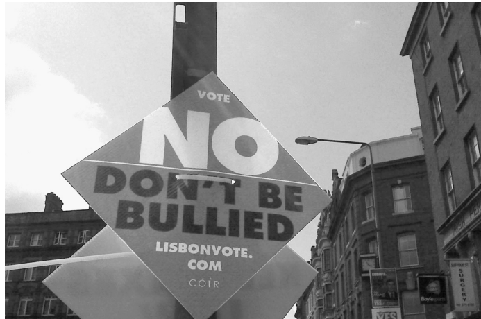
El inequívoco “No” de Irlanda al tratado de Lisboa es un golpe mortal al intento de la oligarquía angloholandesa de obligar a Europa a someterse a una dictadura mundial.