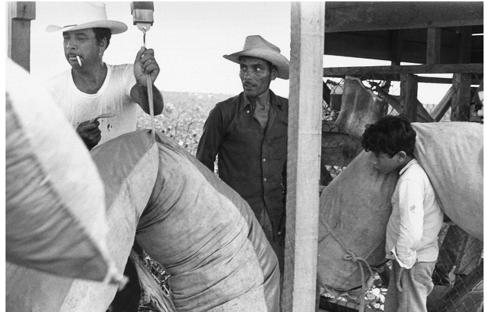
Agricultores cosechan algodón en Sonora, México, en 1972. “Hemos perdido mucha agricultura en esa región —dijo LaRouche— por la migración a EU. Bueno, pues EU va a sacar a muchas de estas personas de regreso para México”. La única forma de restaurar la agricultura ahí es mediante la construcción de grandes obras hidráulicas como el PLHINO.

LaRouche: Hay que ver dos cosas. Hay que ver la degeneración de Nigeria. A Nigeria, que es un país exportador de petróleo, nunca se le permitió desarrollar su producción petrolera. Se privatizó la producción petrolera y se dejó en manos de extranjeros. No había control nigeriano sobre su propio petróleo o su industria petrolera. Los ingresos petroleros en Nigeria se utilizaron para la corrupción. Ya que no había verdadero desarrollo en Nigeria, había comunidades fragmentadas que tendían a estar aisladas unas de las otras. Tenían el equivalente de los caciques nigerianos por todos lados, en donde