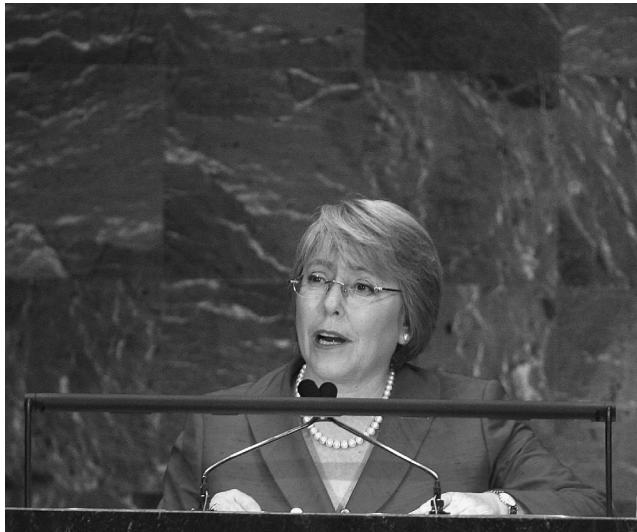
El discurso de la presidenta chilena Michelle Bachelet contrastó con la locura del 14 Foro Económico Internacional de las Américas, que se celebró del 9 al 12 de junio en Montreal, Canadá.