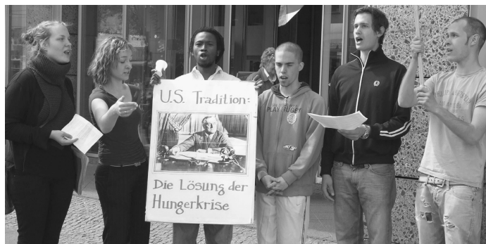
Miembros del LYM organizan el 3 de mayo en Berlín. En el cartel aparece el presidente Franklin Delano Roosevelt, acompañado por la leyenda: “La solución a la crisis es la tradición estadounidense”.

Entre tanto, la movilización internacional del Instituto Schiller y el Movimiento de Juventudes Larouchistas (LYM) en los cinco continentes con el llamado para doblar la producción de alimentos ha coincidido con el esfuerzo de muchos países por abastecer a sus pueblos de comida adecuada, aumentar la producción nacional y, así, liberarse de las