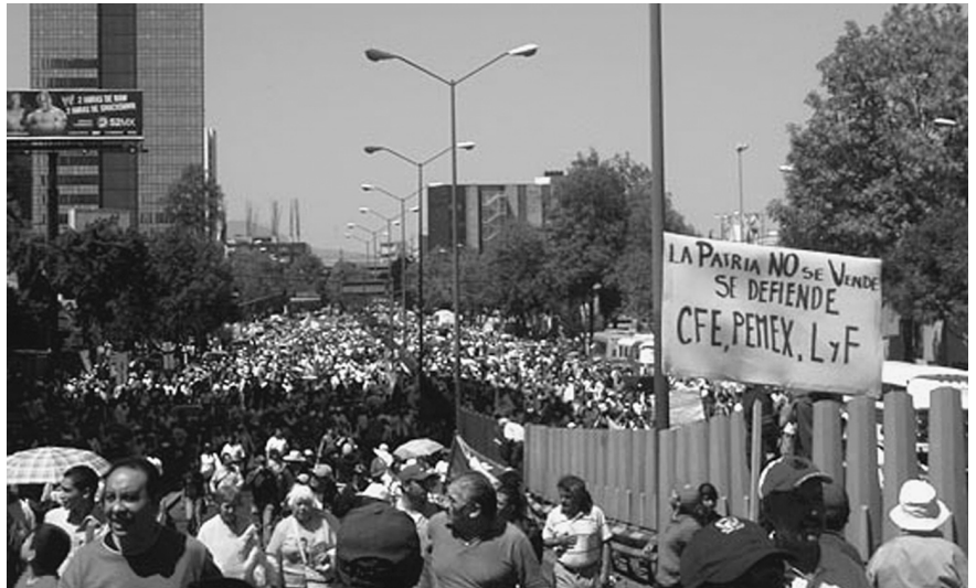
El petróleo de México es un patrimonio nacional y debe usarse con la misión de desarrollar a toda la nación. Trabajadores protestan en febrero de 2008, en la Ciudad de México, contra la ofensiva de intereses financieros internacionales que llevan décadas tratando de privatizar a la empresa petrolera nacional, PEMEX. (Foto: PEMEX).

Tomemos la producción de alimentos. Si hay desarrollo en México, se tiene toda clase de producción de alimentos resistentes a los cambios de estación. Como el problema que todos conocemos en México: la contaminación de las existencias de alimentos, las enfermedades, las plagas. ¿Por qué? Por falta de salubridad. En cuestión de una generación se podría eliminar este problema. Moctezuma ya no sería conocido en México.