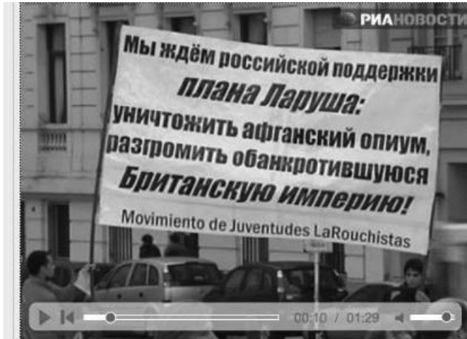
“Miembros del LYM de Argentina reciben a Medvédev en Buenos Aires con un cartel que dice en ruso: “Queremos que Rusia apoye el plan LaRouche: A bombardear los campos de opio de Afganistán; derrotemos al quebrado Imperio Británico”.

LaRouche se refirió a la reciente visita de la secretaria de Estado de Estados Unidos, Hillary Clinton, a la presidenta Cristina Fernández de Kirchner, en la que Clinton, a despecho de los británicos, instó a la Gran Bretaña a negociar con la Argentina sobre las Islas Malvinas. LaRouche dijo que como lo demuestra la secretaria Clinton, la solidaridad entre EU y Argentina es natural, “porque nosotros, en las Américas, tenemos en esencia un interés histórico en la independencia de todos nuestros países como un asunto continental, y tenemos que luchar por asociarnos, en tanto unidad, para defendernos de este problema que nos viene de los británicos”.