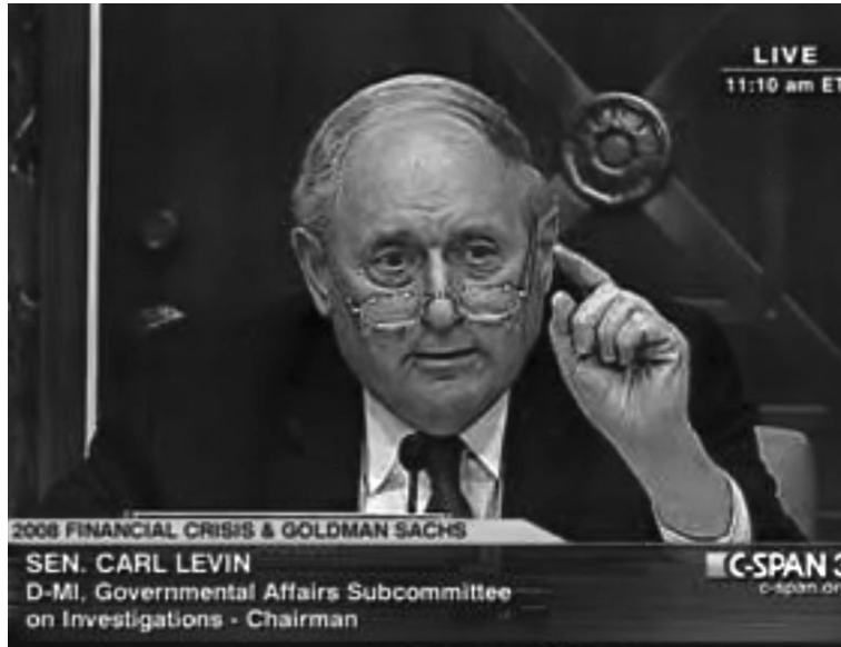
“En las audiencias que presidió el senador Carl Levin de EU, quedó claro que Goldman Sachs estafó a sus propios clientes”.

Al mismo tiempo, la burocracia europea forzó a los gobiernos de Alemania y Francia a aportar fondos de sus contribuyentes para prestarle al Gobierno de Grecia, para que éste le pague a los banqueros. Eso significa transferir el hueco que tienen los bancos a los ministerios de Hacienda de Alemania y Francia, deudas que terminarían pagando los