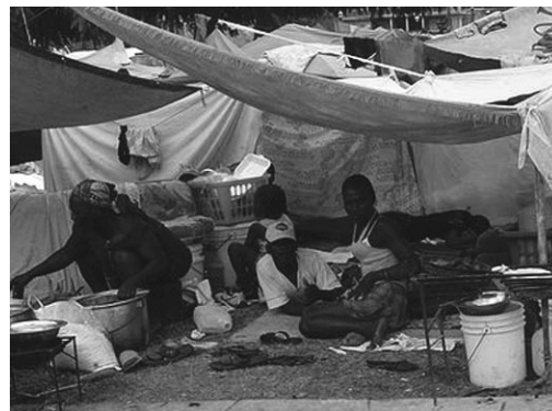
Víctimas del desastre del neoliberalismo en Haití.

El presidente Preval y el primer ministro Jean-Max Bellerive, presentaron un resumen del plan de reconstrucción del Gobierno haitiano. En su primera fase el enfoque será construir nuevos centros de desarrollo regional, donde será necesario establecer o consolidar “infraestructura económica grande, como parques industriales, grandes instalaciones colectivas tales como hospitales y universidades nacionales”. Haití tuvo autosuficiencia alimentaria antes y puede tenerla de nuevo. El plan hace énfasis en la gestión de aguas, la generación eléctrica, la educación, la salud pública, la creación de empleos, y dice que el Estado: “debe crear esperanza y debe afirmar su legitimidad como líder del proceso de reconstrucción