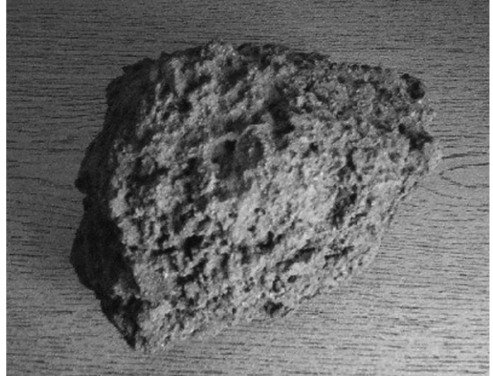
Un ejemplo del concepto de Vernadsky de migración biogénica de átomos: el hierro pantano se produce en varias fases mediante la acción de la biosfera, culminando en la creación de óxidos de hierro mediante la acción oxidante de la bacteria de hierro.

Uno de los mayores problemas a resolver será la cuestión de producir el tipo de ambiente artificial requerido para que la humanidad deje su “vientre materno” aquí en la Tierra. ¿Qué vamos a necesitar llevarnos de la biosfera? ¿Cuál será el papel de los fenómenos electromagnéticos y de la radiación cósmica en ese medio ambiente? Quizá será aconsejable simular el medio ambiente gravitacional de la Tierra, acelerando las naves por el espacio interplanetario a una aceleración igual a la gravedad de la Tierra (1-G), pero esta será la primera vez que tal acto premeditado de aceleración constante haya ocurrido en cualquier lugar del universo. Representará la primera creación artificial de un campo gravitacional sostenido, que si se mantiene por largos períodos de tiempo, resultará rápidamente en velocidades relativistas. ¿Cuál será el efecto de este tipo de viaje sobre la tripulación? ¿Cuál será el efecto en el universo físico de manera más general? Estas cuestiones nos llevan