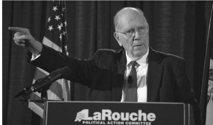
En su videoconferencia del 10 de marzo de 2011, Lyndon Larouche celebró el liderazgo del partido Sinn Féin en Irlanda, por su insistencia en que el gobierno de Irlanda no pague las deudas de los bancos privados.