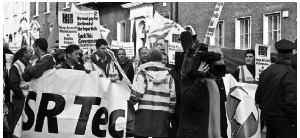
Manifestación sindical en Irlanda, en enero de 2011, justo antes de la caída del Parlamento irlandés. Las pancartas dicen “Mantenimiento a las aeronaves en el aeropuerto de Dublín. No pagaremos la codicia de los superricos. Saquen a este gobierno”.

Obviamente, en realidad, el rescate financiero iniciado en 2008 no fue nada más que un boleto hacia el infierno al que se deberían mandar a todos los “bancos malos” compasivamente, ya.