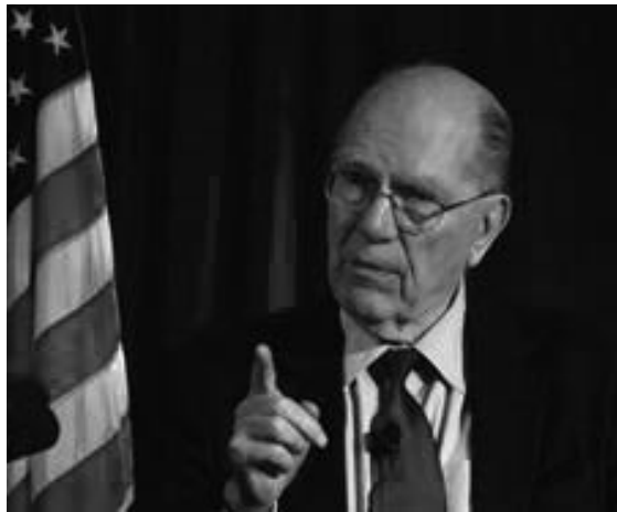
Lyndon H. LaRouche.

Así que, lo que ha sucedido es que ha hecho erupción un movimiento popular que se extiende desde el norte de África hacia Estados Unidos, donde ahora domina el crecimiento de un movimiento de huelga de masas. Lo de Wisconsin ha cobrado fama, por supuesto, pero también ocurre en varios otros estados. Va a extenderse. Es una huelga de masas que no puede controlarse por medios convencionales. Es un movimiento de veras revolucionario. Ahora mismo es un lío del demonio, muy parecido a los tejemenes de la Revolución Francesa. [...]