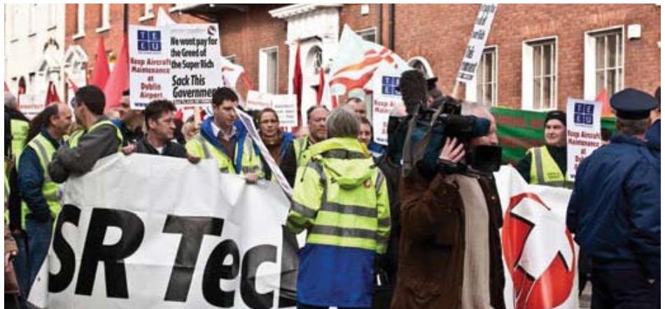
Manifestación sindical en Irlanda, en enero de 2011, justo antes de la caída del Parlamento irlandés. Las pancartas dicen “Mantenimiento a las aeronaves en el aeropuerto de Dublín. No pagaremos la codicia de los superricos. Saquen a este gobierno”.

Obviamente, en realidad, el rescate financiero iniciado en 2008 no fue nada más que un boleto hacia el infierno al que se deberían mandar a todos los “bancos malos” compasivamente, ya.