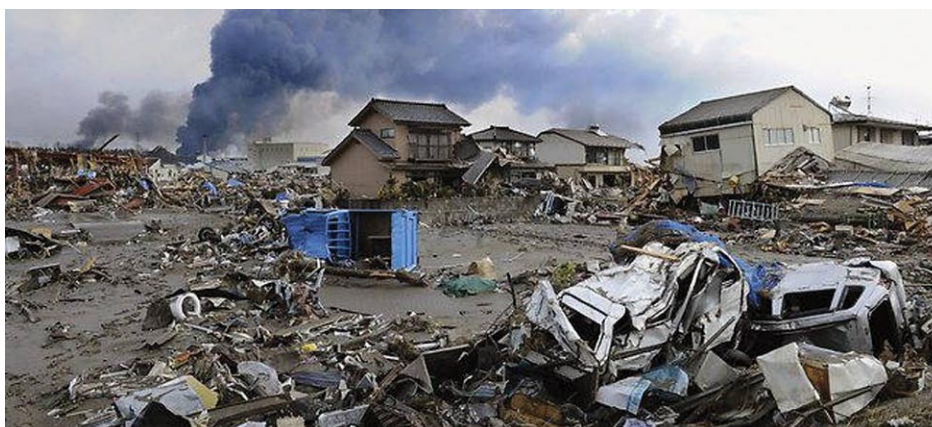
La costa este del norte de Japón, destruida por el tsunami, no por los reactores nucleares.

Merkel capituló ante las mentiras verdes y tomó medidas en contra de la industria nuclear alemana, entre ellas, el cierre casi inmediato de siete nucleoelectricas. Esto solo provocó furia en las bases de la propia CDU, que favorecen la energía nuclear, y redujo así su propio voto en el estado.