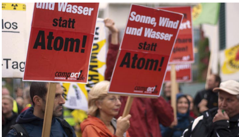
Los lunáticos verdes en Alemania demandan la prohibición de la energía nuclear para sustituirla con energía solar, eólica y demás, lo cual reduciría drásticamente la productividad de la economía alemana y reduciría los niveles de vida de Alemania a los del Tercer Mundo.

Zepp-LaRouche recalcó que esta falta total de conducción en el país en defensa de defender los intereses vitales de la nación alemana, se vio claramente en las semanas previas a las elecciones. La Unión Demócrata Cristiana (CDU), el partido de la canciller alemana Ángela Merkel, que había gobernado en Baden-Württemberg por 58 años, sabía que iba a tener problemas en la elección estatal. ¿Peleó para defender la importante industria de máquinas-herramienta de ese estado, y el principio de progreso económico? Al contrario; la propia