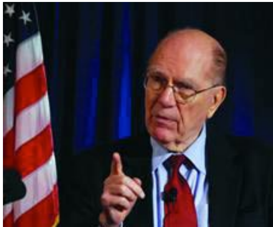
Lyndon H. LaRouche.

Así que, lo que ha sucedido es que ha hecho erupción un movimiento popular que se extiende desde el norte de África hacia Estados Unidos, donde ahora domina el crecimiento de un movimiento de huelga de masas. Lo de Wisconsin ha cobrado fama, por supuesto, pero también ocurre en varios otros estados. Va a extenderse. Es una huelga de masas que no puede controlarse por medios convencionales. Es un movimiento de veras revolucionario. Ahora mismo es un lío del demonio, muy parecido a los tejemenes de la Revolución Francesa. [...]