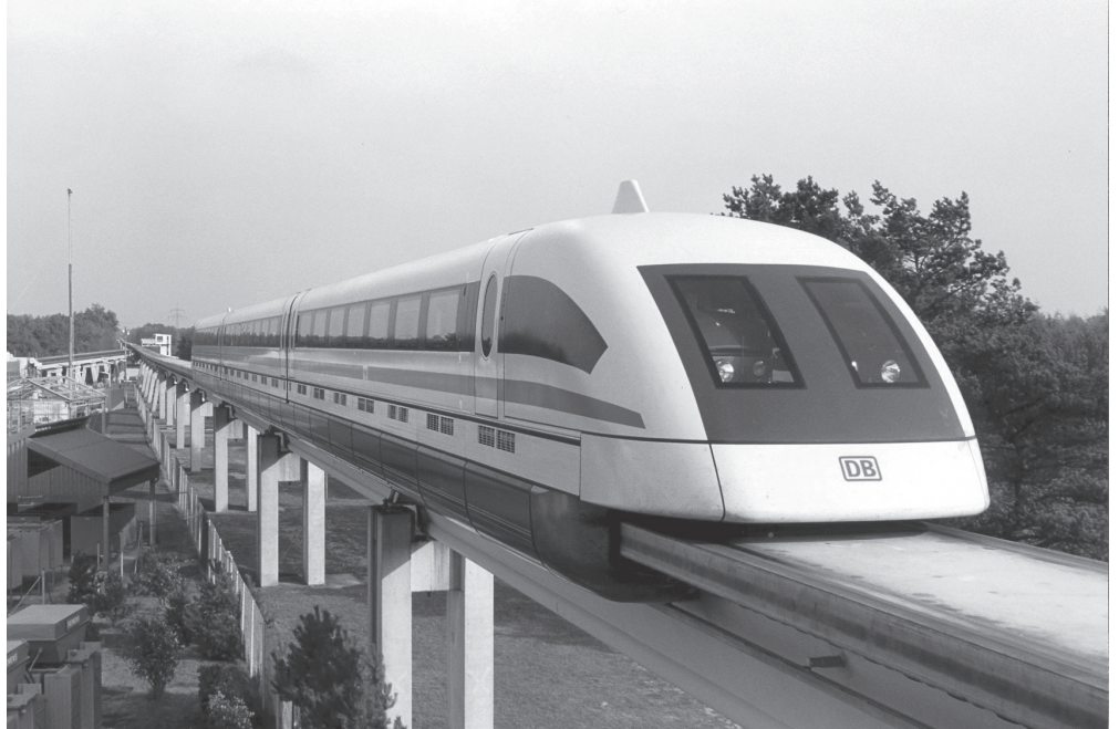
Los candidatos larouchistas al Congreso de EU proponen revivir la idea de un ferrocarril panamericano del ex presidente William McKinley.

Durante el intercambio se abordó la idea de eliminar el concepto de “consumo energético, consumo de agua”. No es que haya una