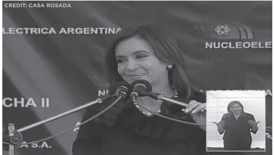
Cristina Fernández viuda de Kirchner, recién reelegida a la Presidencia de la Argentina.

Para los países en vías de desarrollo, el camino tomado por la presidenta argentina representa una alternativa a la extinción a manos del Imperio Británico; ofrece liderazgo en la batalla por sobrevivir, sumado a la “Gran Alianza del Pacífico” de Rusia, China