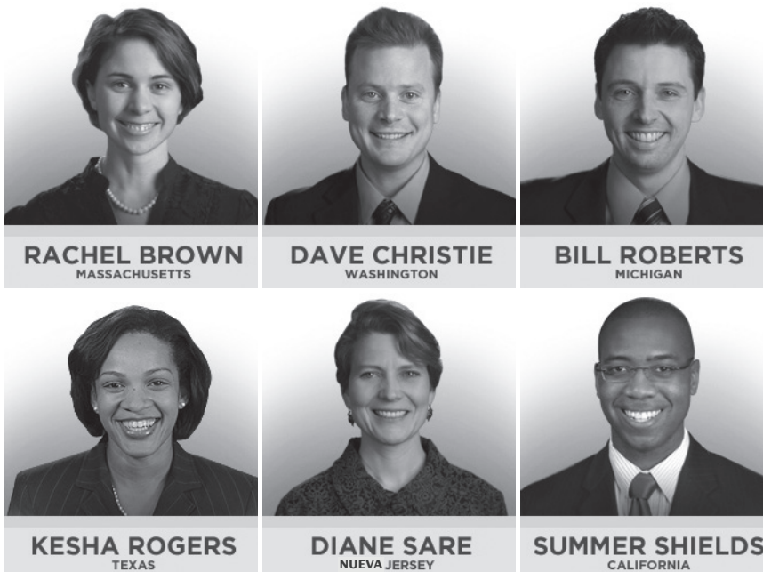
Los candidatos demócratas larouchistas al Congreso de EU.

“Como cuadros de un liderazgo joven en EU, los seis demócratas larouchistas están reclutando a otros para que se unan en pos de la única combinación programática que funcionará: sacar a Obama, reinstaurar la Glass-Steagall y comenzar a construir NAWAPA”.