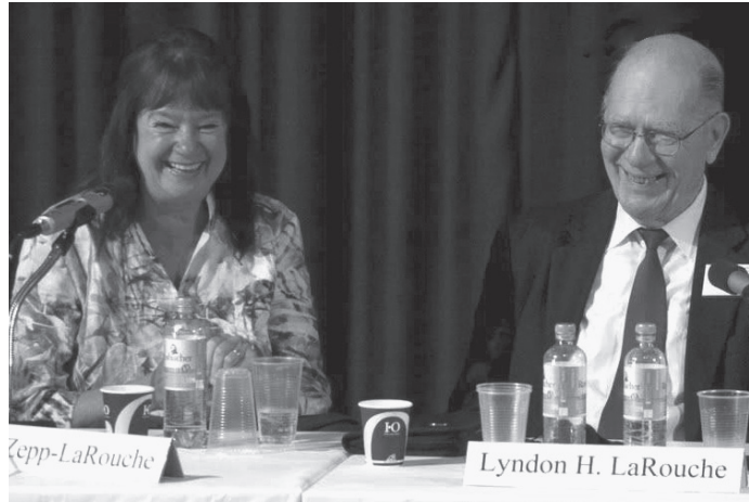
La dirigente alemana Helga Zepp-LaRouche junto con su esposo Lyndon H. LaRouche.