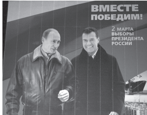
Putin y Medvédev: “Juntos ganaremos”.

La candidatura fue anunciada de una forma tal, que sirvió para demostrar que todas las fantasías occidentales sobre un