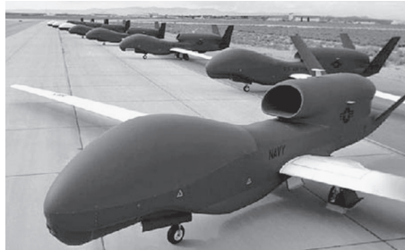
Un vehículo aéreo no tripulado de EU.

Este servicio noticioso, EIRNS, se ha enterado que la noticia publicada por Reuters