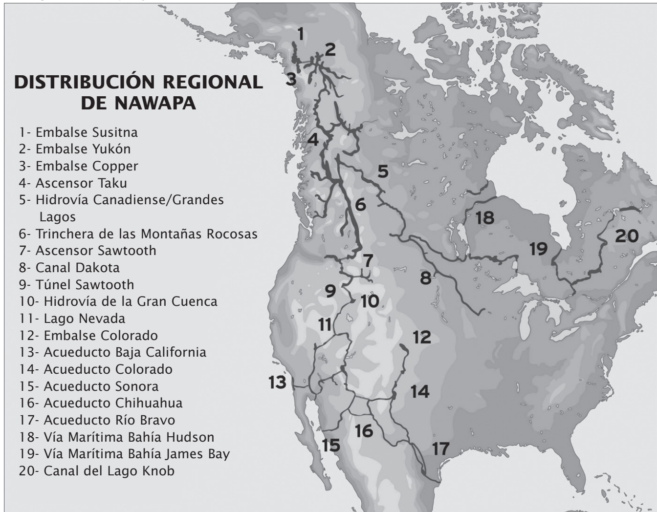
FIGURA 1 Plan general del proyecto NAWAPA

moviéndose, fatalmente, hacia la misma posición en la que fueron eliminados los famosos dinosaurios, ¡como de un solo golpe!