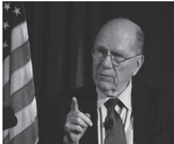
Lyndon H. LaRouche.

Luego tienes que mirar el otro lado de esto: si miras desde, digamos, 500 millones años atrás, por ejemplo, hasta el momento actual, y examinas la historia de los procesos vivientes, verás que la historia es que el orden de los procesos vivientes —que van sustituyéndose unos a otros en este gran tren—va en términos de densidades de flujo energético más altas . En otras palabras, niveles más elevados de concentración de energía. ¡Especies superiores! Las especies superiores en lo biológico reemplazan a las especies de orden inferior; ésa es la característica general de la destrucción de las especies.