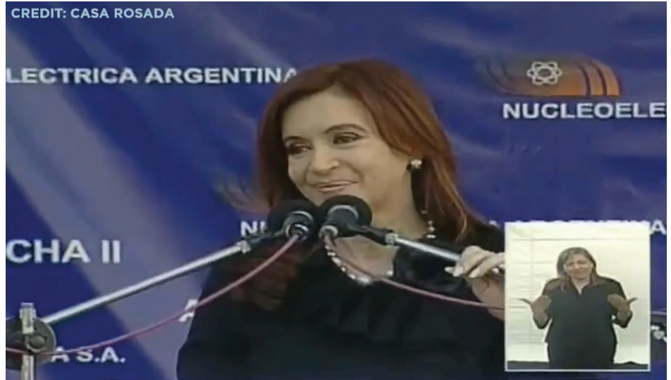
Cristina Fernández viuda de Kirchner, recién reelegida a la Presidencia de la Argentina.

Para los países en vías de desarrollo, el camino tomado por la presidenta argentina representa una alternativa a la extinción a manos del Imperio Británico; ofrece liderazgo en la batalla por sobrevivir, sumado a la “Gran Alianza del Pacífico” de Rusia, China